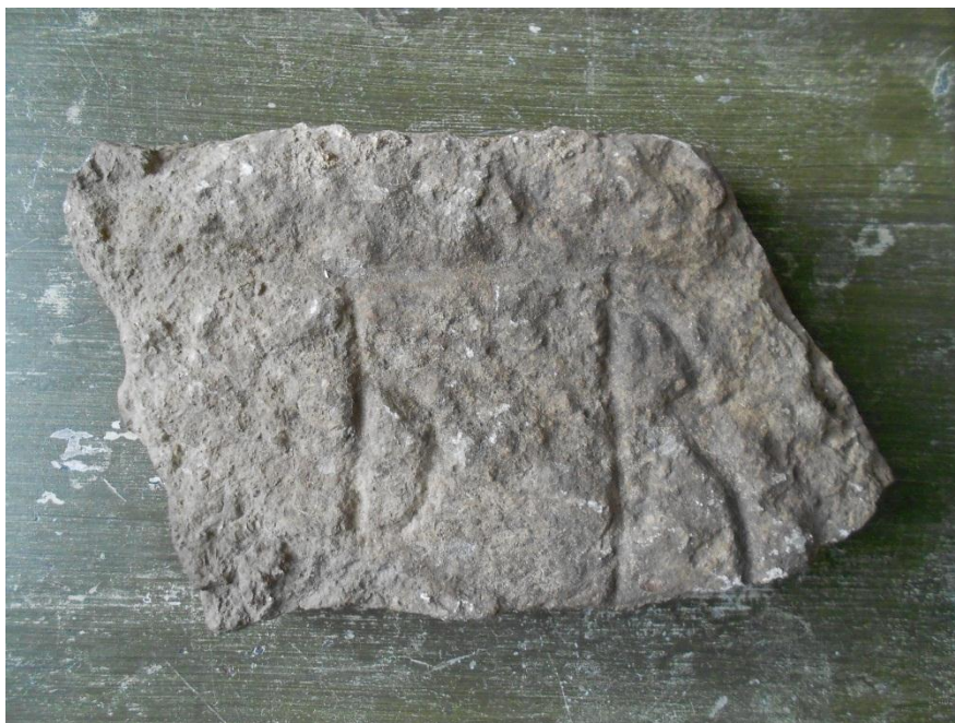
Fig. 2. Fragment C med runorna ...- pr ...