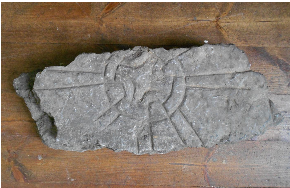
Fig. 4. Fragment D med större delen av ett kors.

På fragment C och D finns spår av bruk, vilket visar att de tidigare måste ha varit inmurade i någon byggnad. Fragment A-B och D fyra påminner mycket om