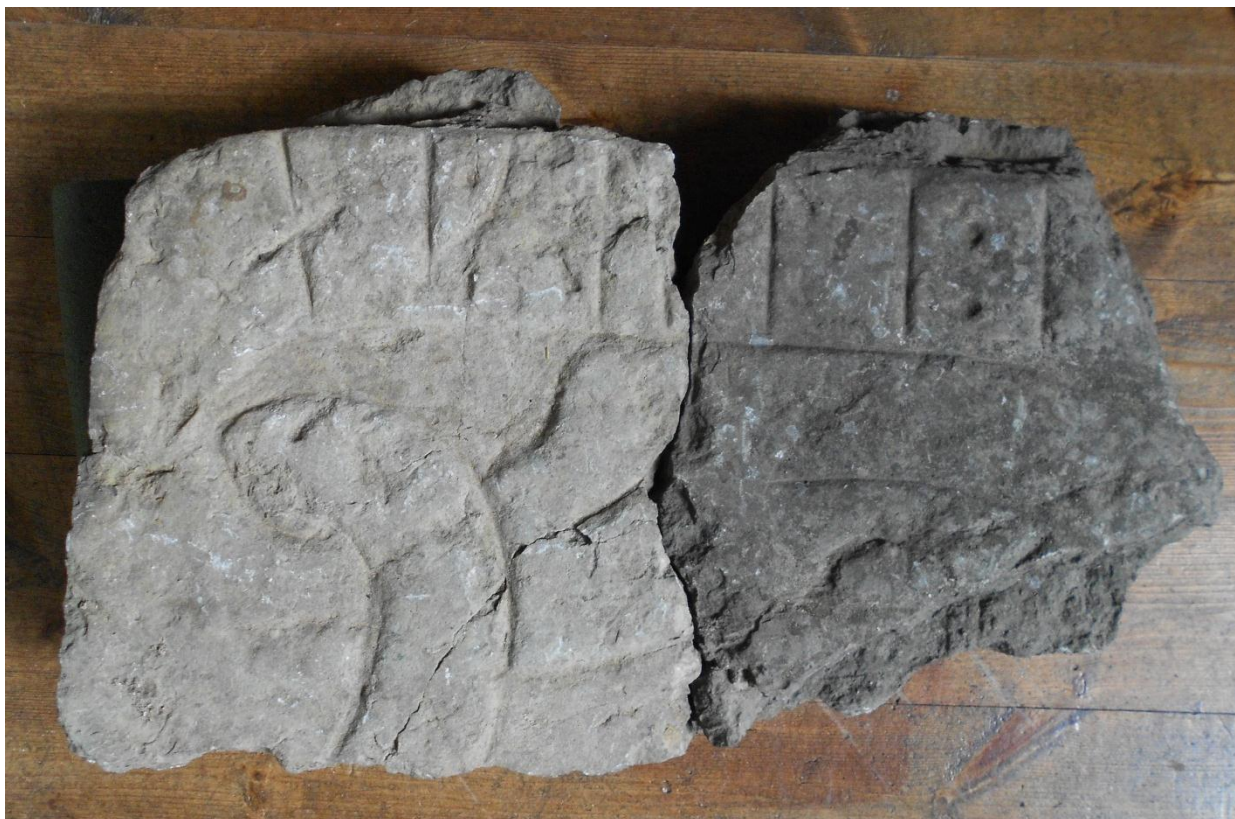
Fig. 1. Fragment A–B från Rinna Kyrka, som har direkt passning.

sidan och följaktligen varit t . Efter 5 i finns ett tydligt kolonformat skiljetecken. Runa 6 består av en rak huvudstav. Släta spår i brottkanten tyder på att runan har haft en bistav till I från toppen och snett nedåt höger.