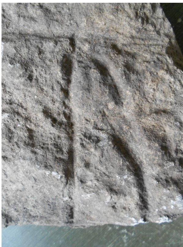
Fig. 3. Detalj av den sista runan på fragment C, som visar hur denna har ändrats från u till r .